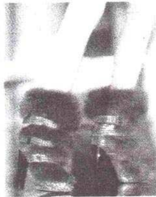
Stivaletti Roberto Cavalli